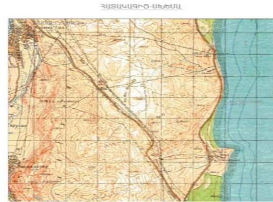
ՕՍԱՌՈՒԹՅՈՒՆ ՀԱՆՐԱՅԻՆ ԼՈՂԱՓԻ ՄԱԿԵՐԵՍԸ ԿԱՑՄՈՒՄ Է 0.78 ԻՊ ՀՈՂԱՏԱՐԱԾ ԱՄԲՈՂՁՈՒԹՅԱՆՔ ԳՏԵՎՈՒՄ Է 1905.0 Ծ ԲԱՑԻՉԱԿ ԵՒՇԻՑ ԲԱՐՉՐ:

ՀԱՅԱՍՏԱՆԻ ՀԱՆՐԱՊԵՏՈՒԹՅԱՆ ԿԱՌԱՎԱՐՈՒԹՅԱՆ ԱՇԽԱՏԱԿԱԶՄԻ ԴԵԿԱՎԱՐ