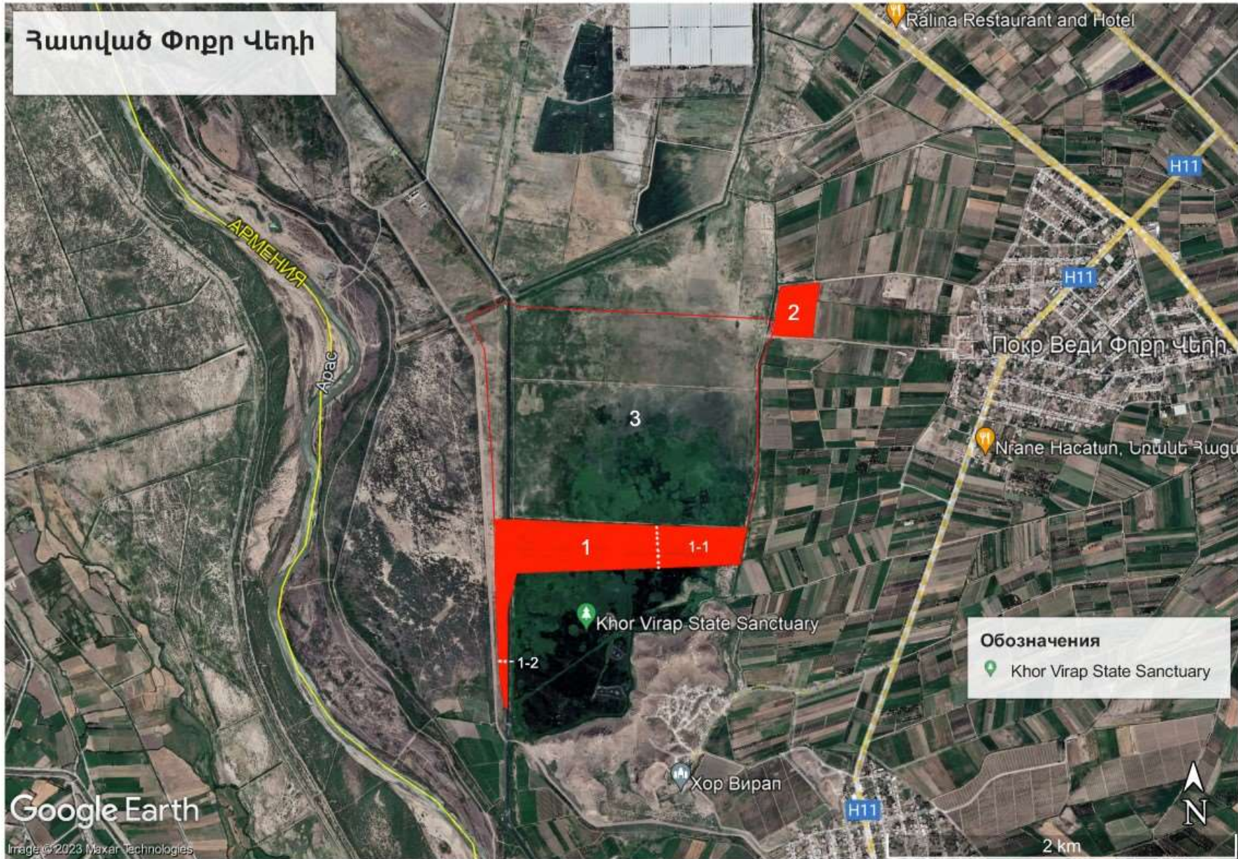
Պատկեր 1: Ուրվագծված և գոտիավորված հատված «Google Earth» քարտեզից: